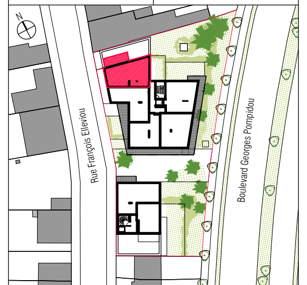
Plan de localisation // 1/1000e

Maitre d'ouvrage : ARC PROMOTION BRETAGNE 1 rue Geneviève de Gaulle-Anthonioz CS 40832 - 35208 RENNES Cedex 2 groupe.arc@groupearc.fr T. 02 99 86 13 86 - F. 02 99 50 58 55 Maitre d'oeuvre : ITAR ARCHITECTURES 66 rue de Turenne 75003 Paris info@itar.fr T. 01 43 57 44 50