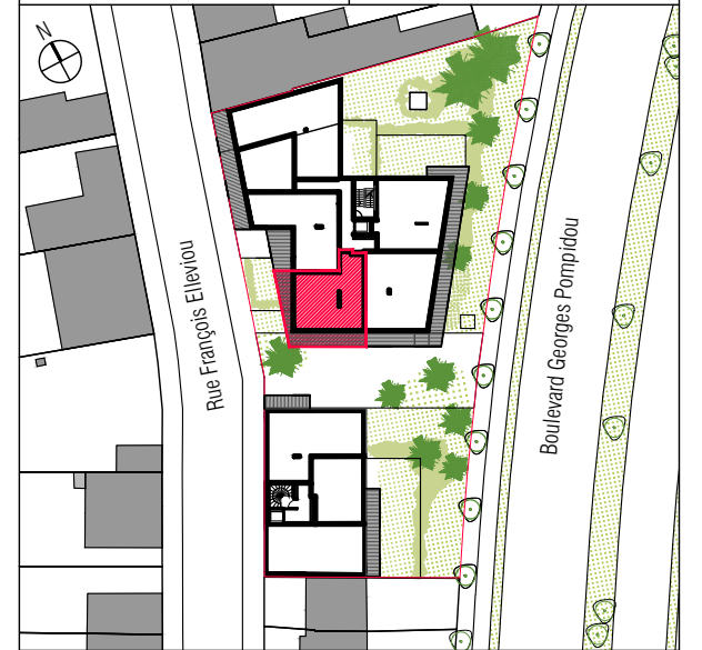
Plan de localisation // 1/1000e

Maitre d'oeuvre : ITAR ARCHITECTURES 66 rue de Turenne 75003 Paris info@itar.fr T. 01 43 57 44 50