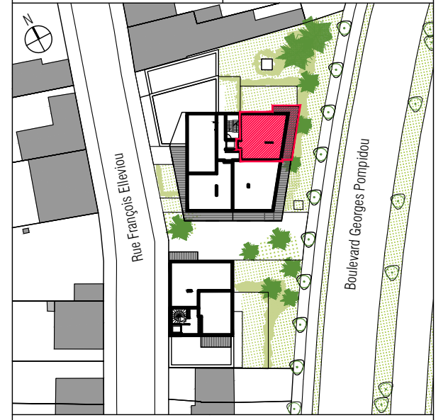
Plan de localisation // 1/1000e

Maitre d'ouvrage : ARC PROMOTION BRETAGNE 1 rue Geneviève de Gaulle-Anthonioz CS 40832 - 35208 RENNES Cedex 2 groupe.arc@groupearc.fr T. 02 99 86 13 86 - F. 02 99 50 58 55 Maitre d'oeuvre : ITAR ARCHITECTURES 66 rue de Turenne 75003 Paris info@itar.fr T. 01 43 57 44 50